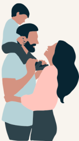
Tさん 40代 主婦

私は娘が「子育てワーキングママ」として、 日々仕事と育児を両立させながら懸命に頑張っている姿を見て このプログラムを購入しました。 娘は毎日忙しく、子どもの世話に追われて自分の時間をほとんど持てない生活です。 また、自分が自由に使えるお金を得たいという思いも持っていました。 このプログラムは、そんな娘にぴったりだと思いました。 今どきの子ですからSNSの使い方も慣れていきます笑 すぐに取り組める内容が多く、忙しくても無理なく実践できているようです。 特に、隙間時間をうまく活用して副収入を得られるというところが良く、 娘の表情が明るくなったのを見て心から購入して良かったと思いました。